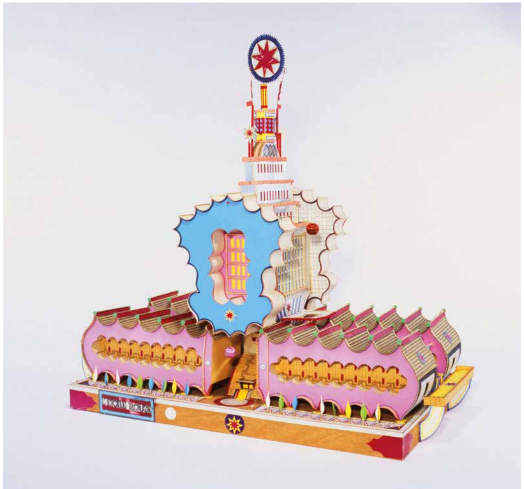
BODYS ISEK KINGELEZ , Étoile Rouge Congolaise , 1990. © the artist. Courtesy: C.A.A.C. - The Pigozzi Collection, Geneva

Now, that's one part of the puzzle. The second part of the puzzle is that most African countries, and cities by extension, are what we call least-developed countries. In other words, the average incomes are between $500 and $800 per capita per annum.