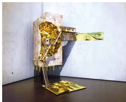
VIGILISM, Where there's gold: mining way station, 2014. Copyright and Courtesy: Oialekan Jeyifous, Vigilism, New York

We also know that the economy is shifting and the way people live is shifting, so we don't have to coordinate everything on a global scale. Decentralization and processes of localization will become very important. What you will see is almost a cascading of these coordination-centralising functions at multiple levels, from the global scale—global cities—to the regional level within Asia or South-Asia, to Africa and so forth, but then also within sub-regions. So if we look at the region where we live in Southern Africa, Johannesburg and the greater Gauteng municipal area will become a key player. This wasn't the case ten years ago.