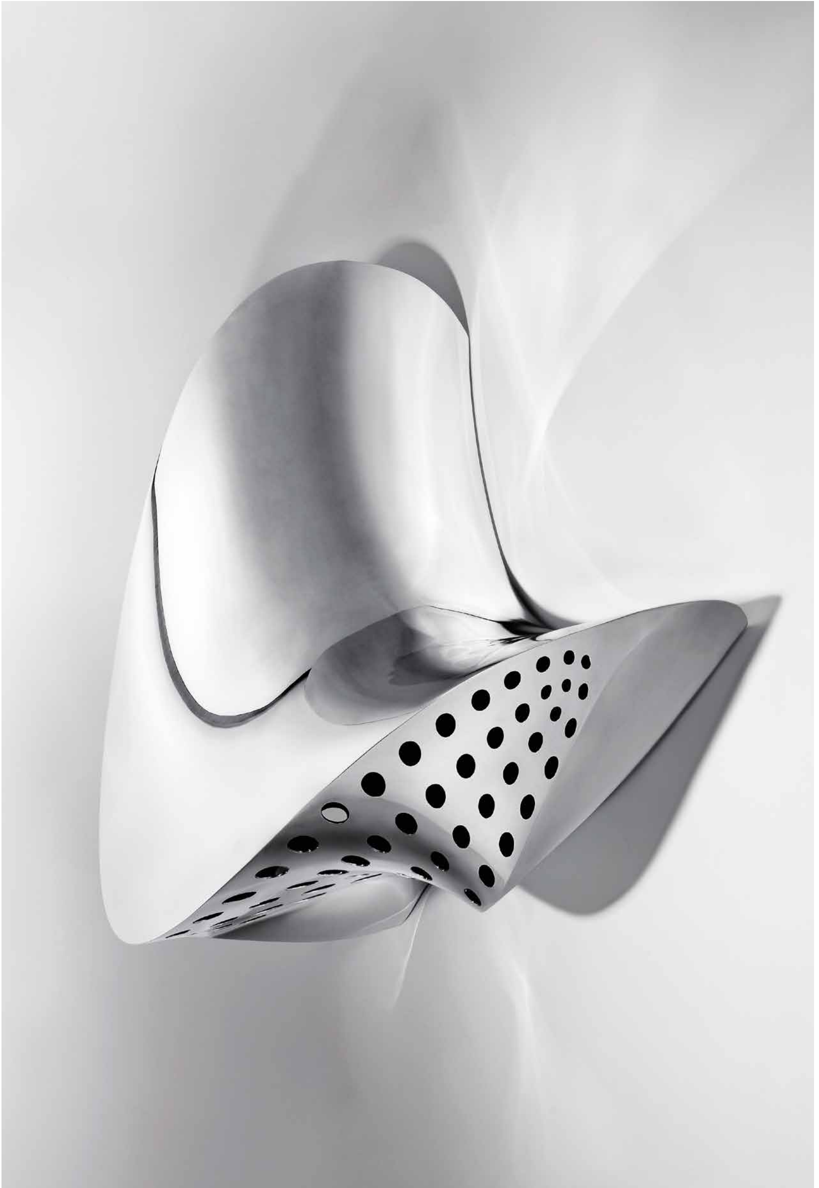
EXPAND DESIGN , Splice , 2012. © Ifeanyi Oganwu. Courtesy: Expand Design Ltd, London; Galerie Armel Soyer, Paris and Private Collection