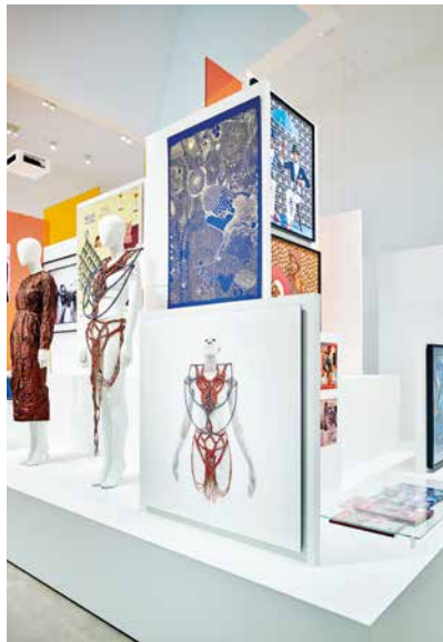
"I and We" installation view at Vitra Design Museum, Basel, 2015.

It is very difficult to return to a conception of collective ownership in a context where the political custodians have often corrupted those very ideas. On the other hand, we also know that if you go for a pure, market-driven, individual, privately-owned model for collective resources, like water and forests and ecosystem services, or land, for that matter, that that will be a disaster as well, for exactly the reasons that I mentioned before—you've got so few people who are participants in a formal market economy. Because you've got very low incomes, you've got highly informal and uneven market systems, you can't rely on a set of mechanisms that assumes everyone is a rational consumer in a formal economic system.