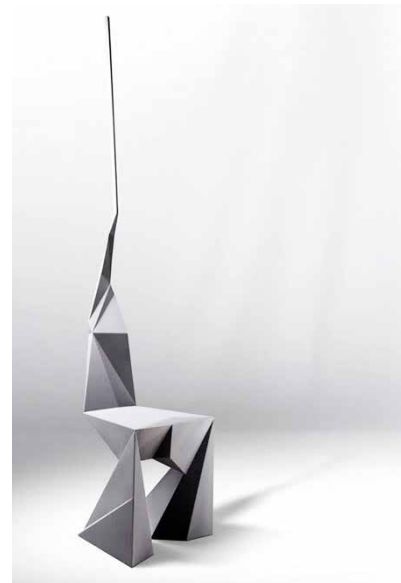
KOSSI AGUESSY, Useless Stool, 2008. Copyright and Courtesy: the artist. Photo: Masaki Okumura

genuine, new innovation, and to figure out how to live at a smaller scale in a highly precarious world.